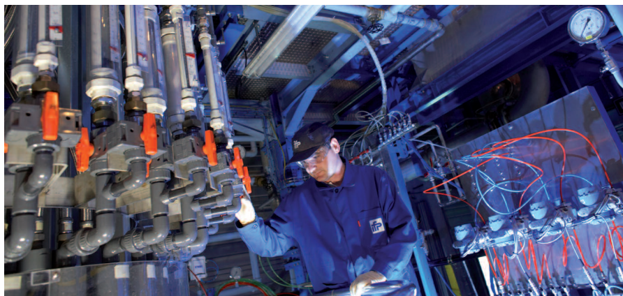
L'IFP étudie, sur une unité pilote, l'hydrodynamique des contacteurs gaz/liquide pour optimiser le captage du CO 2 par des solvants.

Testé sur pilote au Danemark et amélioré entre 2004 et 2008 dans le cadre du projet européen Castor coordonné par l'IFP, le captage par MEA (monoéthanolamine) est aujourd'hui l'une des seules méthodes déjà disponibles sur le marché en postcombustion. Sur la base des résultats obtenus par Castor, l'IFP a mis au point le procédé HiCapt , commercialisé par Prosernat. HiCapt consiste à introduire les fumées en pied d'une colonne d'absorption pour les laver avec une solution d'eau et d'amine. Ce solvant, qui fixe le CO 2 , est ensuite chauffé dans une tour de régénération, où il relâche le CO 2 qui peut alors être comprimé pour être transporté, puis stocké. L'IFP a conduit des travaux pour améliorer ce procédé : HiCapt+ permet de réduire la taille des installations et de limiter la quantité d'énergie utilisée. Il sera testé sur le pilote industriel de Brindisi (Italie) dans le cadre d'un partenariat entre l'IFP et ENEL. Ce pilote captera 2 à 2,5 tonnes de CO 2 par heure sur une centrale à charbon de l'électricien italien.