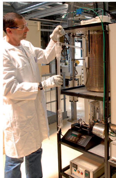
Réacteur en lit fluidisé développé à l'IFP pour les études en batch du procédé CLC.

Pour parvenir à l'industrialisation du procédé, il faut encore relever de nombreux défis. Premier axe de travail : l'identification des meilleurs oxydes métalliques. Des études sur ces matériaux ont notamment été conduites dans le cadre du programme européen Encap, dans lequel l'IFP a coordonné les actions liées à la CLC, et au sein d'un projet de l'Agence nationale de la recherche (ANR), CLC-Mat, piloté par l'IFP. En 2008, l'IFP a lancé avec Total des études de développement de procédés. Un accord de collaboration de plusieurs années a ainsi été conclu, visant à développer la CLC avec la mise au point d'un pilote de validation.