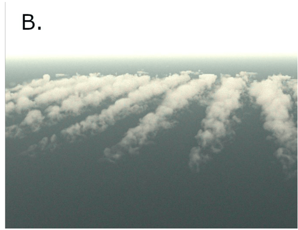
B. Simulation numérique du cas photographié. Joulin et al 2020.

L'excellence des compétences IFPEN en matière de « contrôle des systèmes » a été reconnue en 2019 à l'occasion d'une compétition internationale prestigieuse pour le domaine houlomoteur .