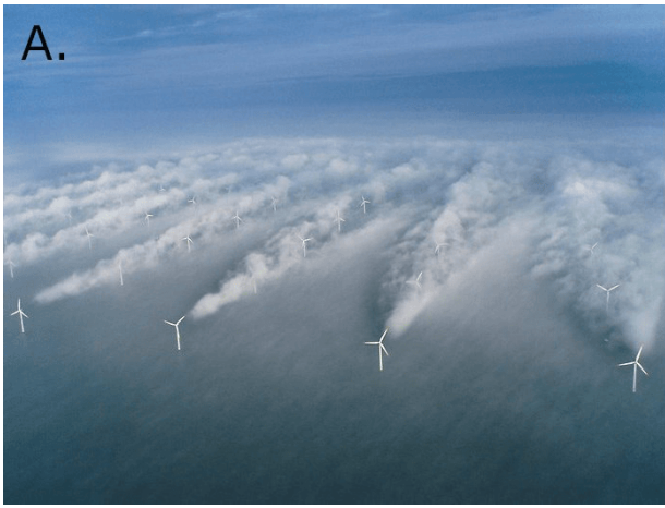
A. Horns Rev 1 wind farm (Hasager et al., 2013).