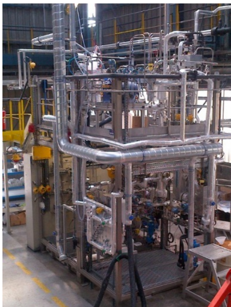
Unité pilote du procédé DMX

Le procédé DMX™ est dédié au captage du CO 2 dans les émissions des installations industrielles : centrales thermiques au charbon, cimenteries, aciéries, etc. Il vise à améliorer les performances des procédés classiques aux amines, qui présentent une forte consommation d'énergie pour la régénération du solvant. Le gain énergétique ciblé est compris entre 30 et 40 %. La solution repose sur un solvant à très grande capacité cyclique qui décante en deux phases, et dont seule la phase la plus riche en CO 2 est envoyée à la régénération. La stabilité chimique de cette dernière phase permet une régénération en température et la production de CO 2 à pression élevée (jusqu'à 6 bar.eff). On peut ainsi économiser deux étages de compression par rapport aux procédés classiques. Les essais réalisés sur mini pilote ont montré l'efficacité du procédé DMX™ à petite échelle et sur du gaz synthétique.