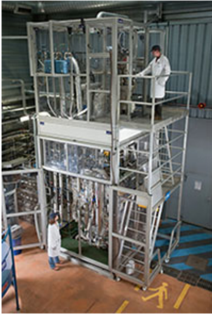
Pilote CLC IFPEN/TotalEnergies à IFPEN-Lyon

biomasse, etc.), libère l'oxygène nécessaire à la combustion, produisant des effluents uniquement composés de vapeur d'eau et de CO 2 . Il est alors facile d'isoler le CO 2 par simple condensation de la vapeur d'eau. Le grand avantage de ce procédé est de parvenir à cette séparation sans étape additionnelle et donc de présenter un meilleur bilan énergétique que ses concurrents. Les travaux de recherche sont validés grâce à plusieurs maquettes froides et sur un pilote de 10kW. Ils bénéficient du savoir-faire des équipes d'IFPEN en matière de lits fluidisés et de matériaux.