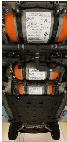
Véhicule PaC au banc à rouleaux / réservoirs véhicule PaC

Une collaboration d'envergure a démarré mi-2023 avec la PME INOCEL pour le développement industriel de leur PaC haute puissance (300kW).